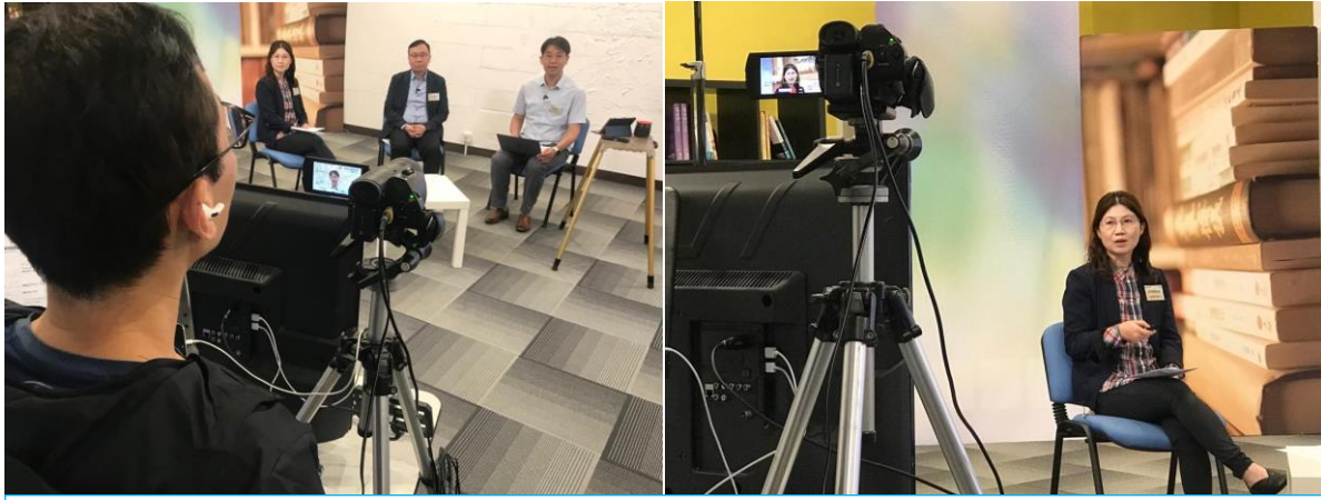
3月舉辦「壞領袖」講座，與現職牧者及教會領袖對談， 教牧篇及領袖篇共服侍近 150 位教牧及領袖，包括海外參加者。

在緊絀的現金流下，加上以上維修項目的支出，令我們更感吃力，特別是「電巴」是刻不容緩的工程。誠邀您為本會需要代禱，並奉獻支持「皇廷設施基金」，讓同工能無後顧之憂，在皇廷廣場這個基址繼續為神國忠心服侍。 參考奉獻方法： 奉獻支持 （註明：皇廷設施基金）或掃描右方二維碼。謝謝！